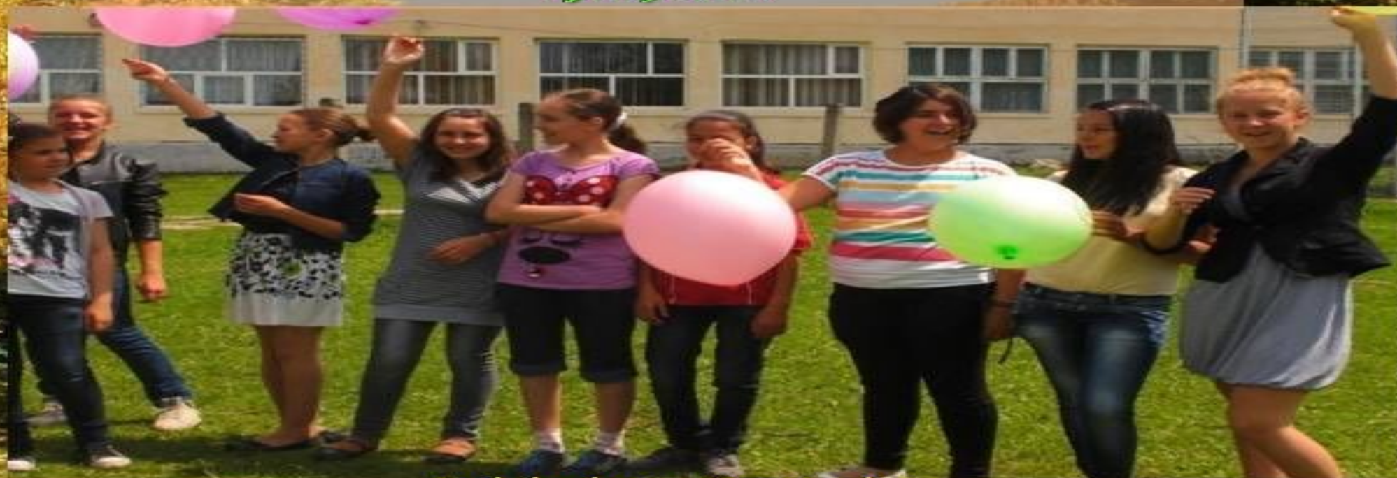
Asul elevilor, nr.39- noiembrie 2012

"Toamnă a deliciașilor! Suflătorul meu cel mai adânc este cuminat cu ea; dacă aș fi a păsăre, aș zbura de-a lungul întregului pământ în căutarea a miș și miș toamne." George Eliot