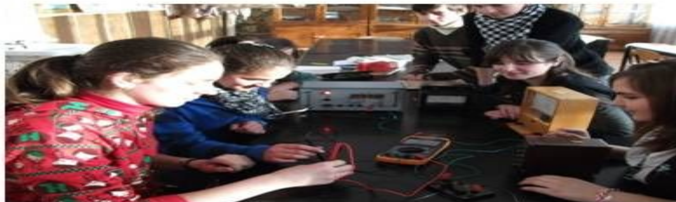
Asul elevilor, nr.39- noiembrie 2012

Principalul scop didactic al experimentului se axează pe formarea unui sistem de gândire logică a elevilor, alături de însușirea unui limbaj corespunzător (prin explicații ale profesorului). Aceste explicații se vor structura și se vor prezenta astfel încât sarcina de învățare va putea fi înțeleasă și controlată de elev. Profesorul trebuie să-și organizeze activitatea și exprimarea într-o progresie a complexității, trecerea fiind treptată, fără salturi mari, astfel încât educabilul să poată urmări evoluția gândirii și activitățile profesorului în scopul organizării propriului experiment. Pentru dezvoltarea vocabularului științific al elevilor, li se vor solicita scurte descrieri ale experimentului.