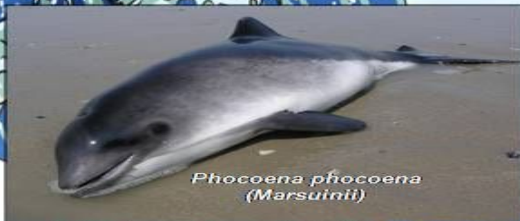
Phocoena phocoena (Marsuinii)